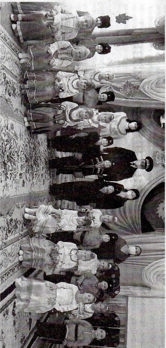
Дружные команды казачат из кружков «Казачата» и «Соловушка».