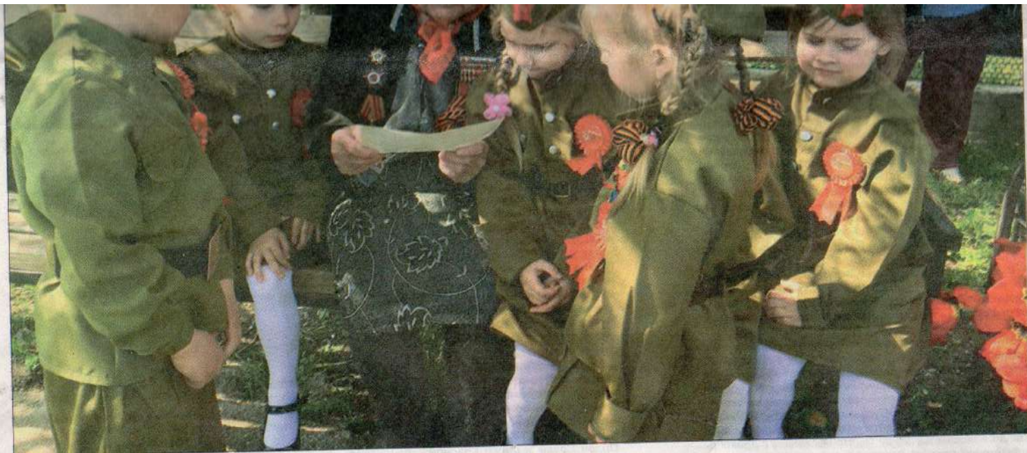
Это была трогательная встреча: к ветерану войны пожаловали воспитанники детсада № 1.